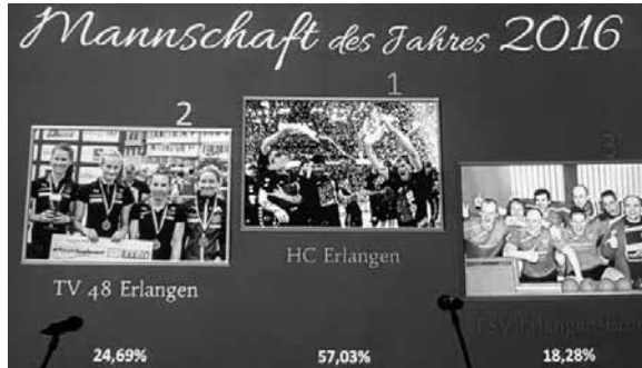
Rangfolge der Sportlerwahl der Mannschaften

Die Brucker Zweitligafrauen haben aus den drei Spielen seit Jahresbeginn immerhin 4 Punkte holen können. Im Heimspiel gegen Bayreuth gab es einen klaren 6-2 Sieg. Beim Auswärtsspiel bei den heimstarken Thüringerinnen vom SV Pöhlitz langte eine starke Leistung nicht zu einem Sieg oder Unentschieden. Mit starken 3420-3559 Holz musste sich am Ende mit 3-5 geschlagen geben. Dafür konnte man eine Woche später in Helmbrechts gewinnen. Nur knapp mit 5-3 und 20 Holz Vorsprung holte man sich die Punkte. Mit 17-11 Punkten liegt man aktuell auf dem 4. Tabellenplatz, ist aber nach Minuspunkten punktgleich mit dem zweiten Platz, der schon zur Teilnahme an den Aufstiegsspielen zur ersten Bundesliga berechtigt. Fünf Spieltage vor dem Ende der Kegelsaison steht die 2. Mannschaft mit nur zwei Punkten Rückstand auf einem guten 2. Platz.