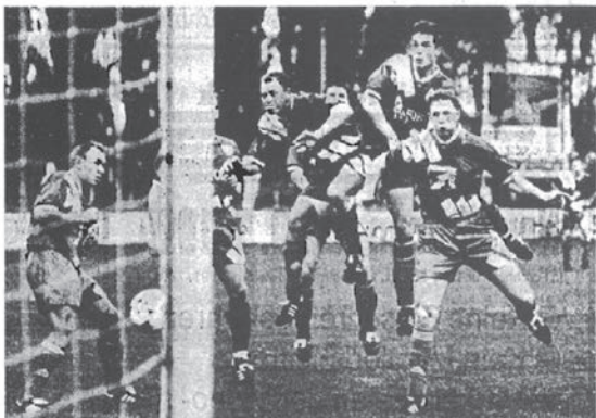
Bruck Tor im Blickspalt, aber Vestenbergsgreuth brachte auch diesen Eckball nur in Richtung, aber nicht in das Tor.

In der zweiten Halbzeit spielten die Brucker dann ihr Spiel. abersten