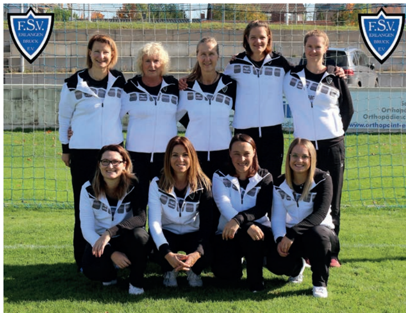
1. Damenmannschaft (1. Bundesliga)