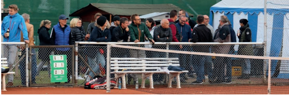
Zahlreiche Zuschauer bei den Finalspielen

Kurz vor unserer Winterpause standen am 28.09.19 traditionell wieder die 12. offenen Vereinsmeisterschaften auf dem Programm. Zahlreiche, spannende Spiele standen auf dem Plan, um sich den Titel Vereinsmeister 2019 zu sichern.